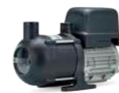
Vacuumarator™ Jets™ C200 Ultima 230V