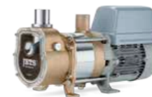
Vacuumarator™ Jets™ 15MB 230V