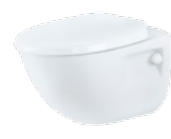
Charm by Jets™ Veggmodell