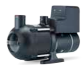
Vacuumarator™ Jets™ C200 Ultima 12V