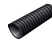
Til offentlig avløp