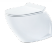
Jade by Jets™ Gulvmodell