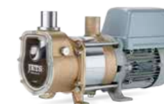
Jets™ 15MB 230V