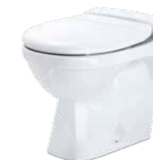
JETS™ 50M Gulvmodell, porselen