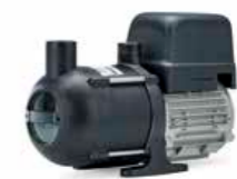
Jets™ C200 Ultima 230V