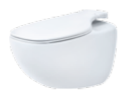
Pearl by Jets™ Veggmodell