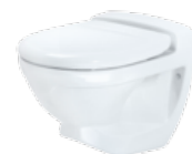
Jets™ 59M Veggmodell

Jets™ leverer nedgravbare tanker i en rekke størrelser. Den laveste tanken bygger kun 80 cm i høyden. Har du ikke mulighet til å grave ned tanken, leverer vi også en meget plasseringsvennlig overflatetank for tildekking.