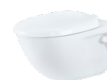
CHARM BY JETS™ Veggmodell, porselen