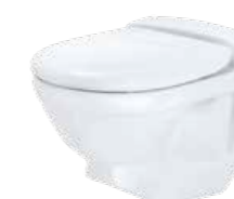
JETS™ 59M Veggmodell, porselen