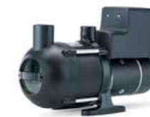
Jets™ C200 Ultima 12V