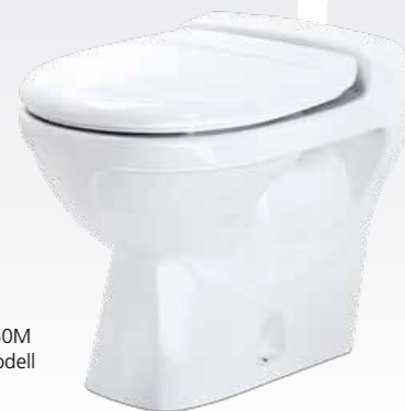
Jets™ 50M Gulvmodell

CVS står for Constant Vacuum System og er basert på konstant vakuumsystem i rørene. Dette systemet brukes i større installasjoner eller ved lange rørstrekk. Kontakt Jets™ for mer informasjon.