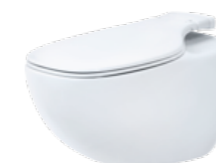
PEARL BY JETS™ Veggmodell, porselen