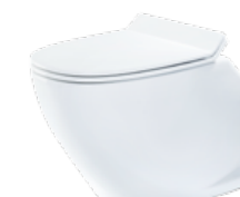
JADE BY JETS™ Gulvmodell, porselen