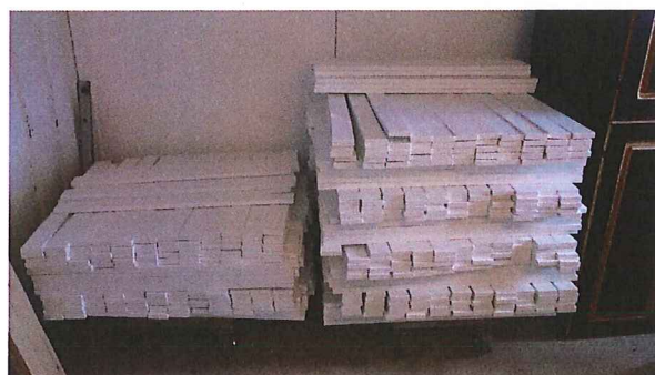
(Bilder fra 2014)