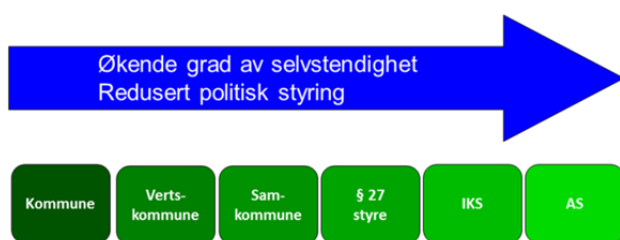
Figur 1- Lovfesta modeller for interkommunalt samarbeid

Kommuner kan samarbeide på ulike måter, med ulik grad av styringsmuligheter, se Figur 1 under. En av disse måtene å samarbeide på er den såkalte vertskommunemodellen. Modellen er utformet med tanke på samarbeid mellom to eller flere kommuner om løsning av oppgaver som er lovpålagte, eks. innen barnevern, skole, helse- og sosial, landbruk, mm.