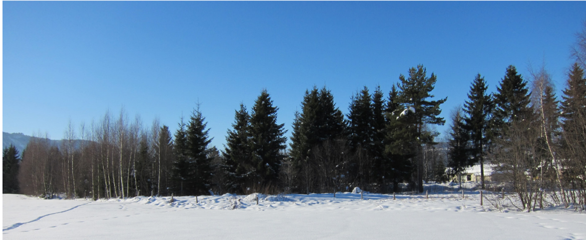
Figur 2 - Deler av Torstumoen sett fra jordet sør for området.