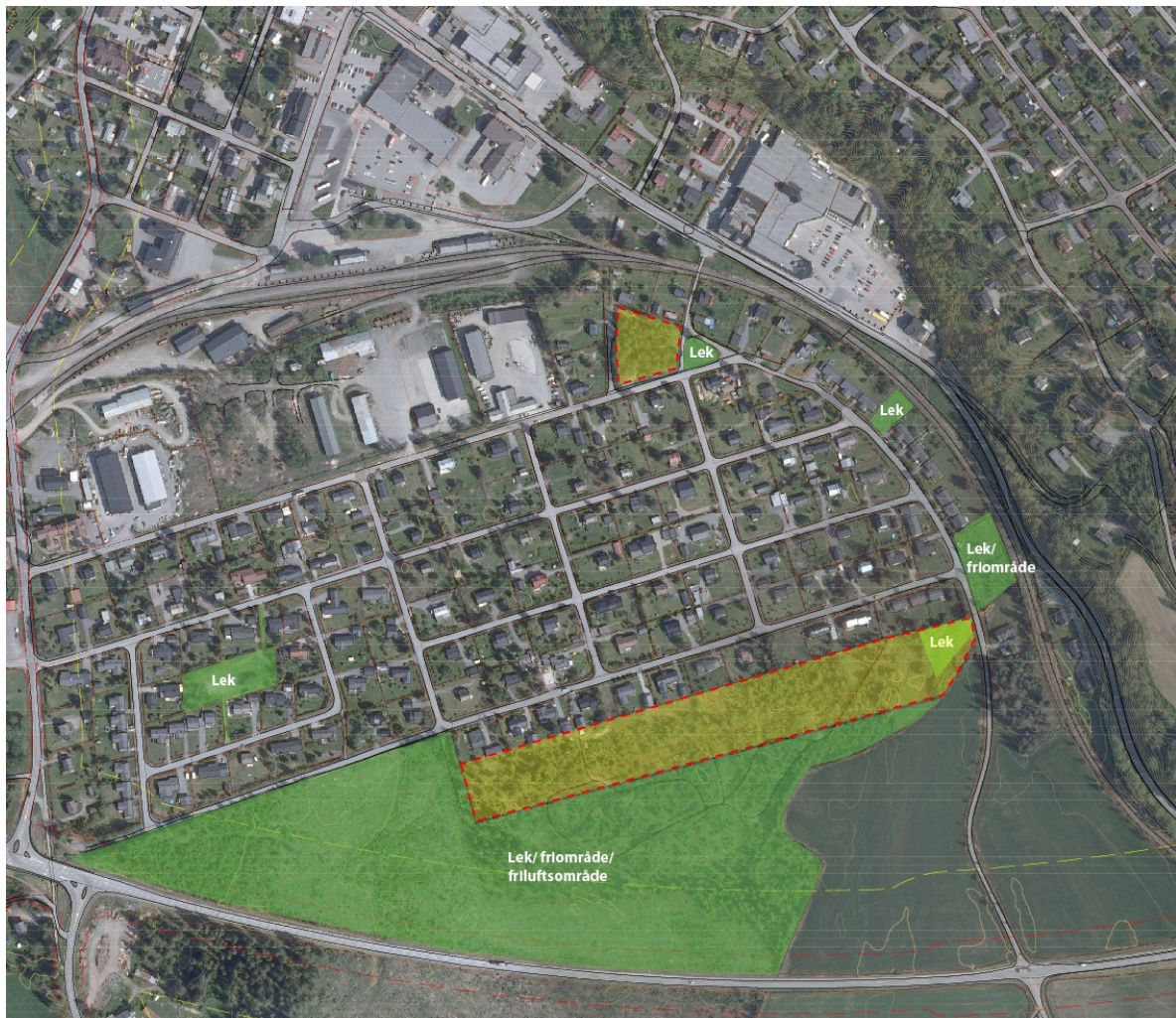
Figur 5 - Lekeområder/ friområder i Torstu-området med nye boligområder.

Som nevnt over innebærer tiltaket at det bygges boliger på et område som i dag benyttes som lekeområde for barn i nærområdet. I planforslaget er det innarbeidet en nærlekeplass i sørøstre del av planområdet. Sammen med friluftsområdene på de gjenværende arealene på sørsiden av planområdet vil dette gi tilstrekkelig areal til lek og fritidsaktiviteter for alle aldersgrupper.