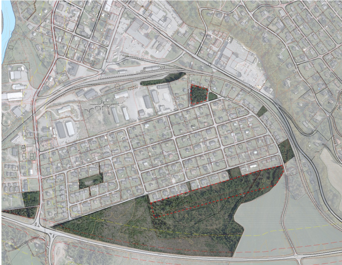
Figur 4 - Grønnstruktur, tilgjengelige grøntområder i nærområdet.

I tillegg til disse områdene utgjør selvsagt landbruksområdene inntil Torstu en del av den overordna grønnstrukturen. Omrisset av planområdet viser at noe grønnstruktur blir beslaglagt. Hovedtrekkene i den lokale grønnstrukturen beholdes.