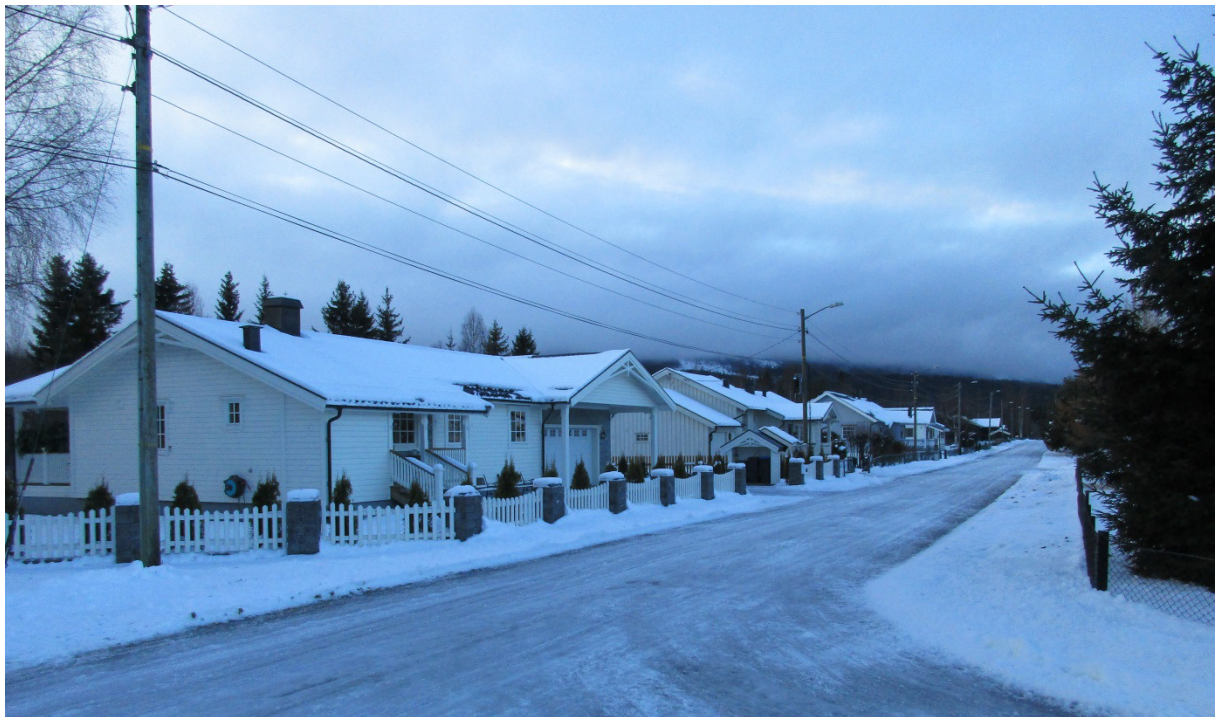
Figur 3 – Eksisterende bebyggelse mot Nordligata.