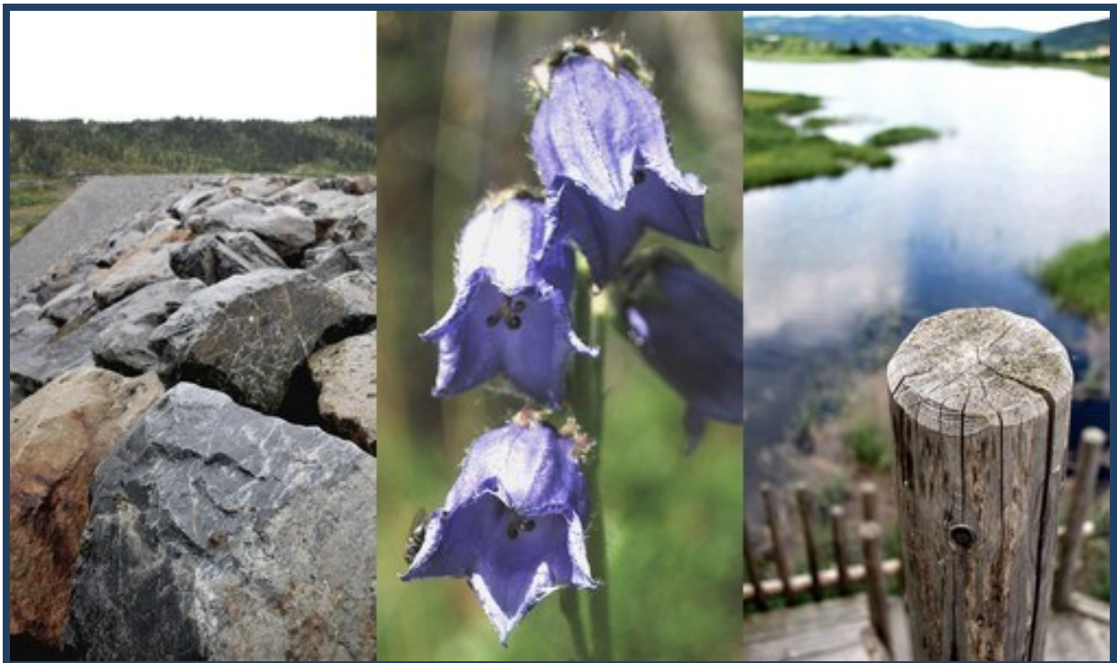
Doksflyødammen, skjeggklokke og Dokkadelta.