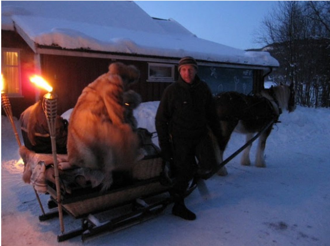
Med hest og slede ble personer med nedsatt funksjonsevne eller handikappede fraktet ut til kunsten.