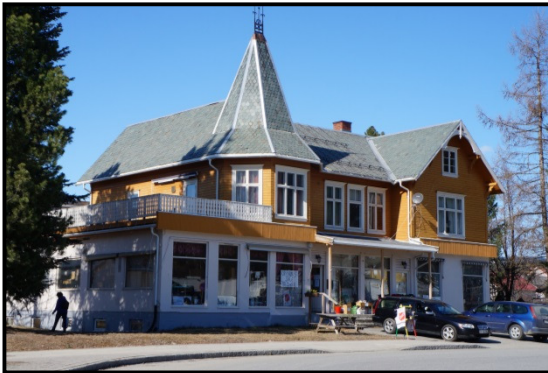
Bilde 4: Qvalegården (Parkgata 8), i dag.