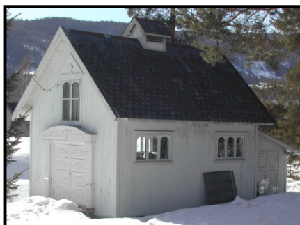
Bilde 7: Bårehuset i Vokksgata 25 B.