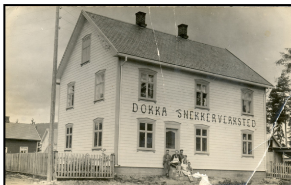
Bilde 3: ...og med tidligere virksomhet