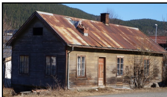
Bilde 1: Skomakerverkstedet, Meierigata 4.