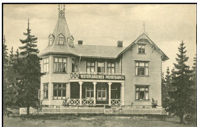
Bilde 6: ...og som bank seinere.