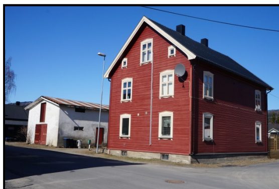
Bilde 2: Meierigata 14 nå, ...