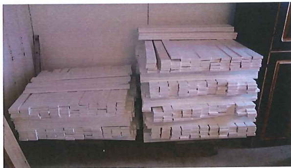
(Bilder fra 2014)